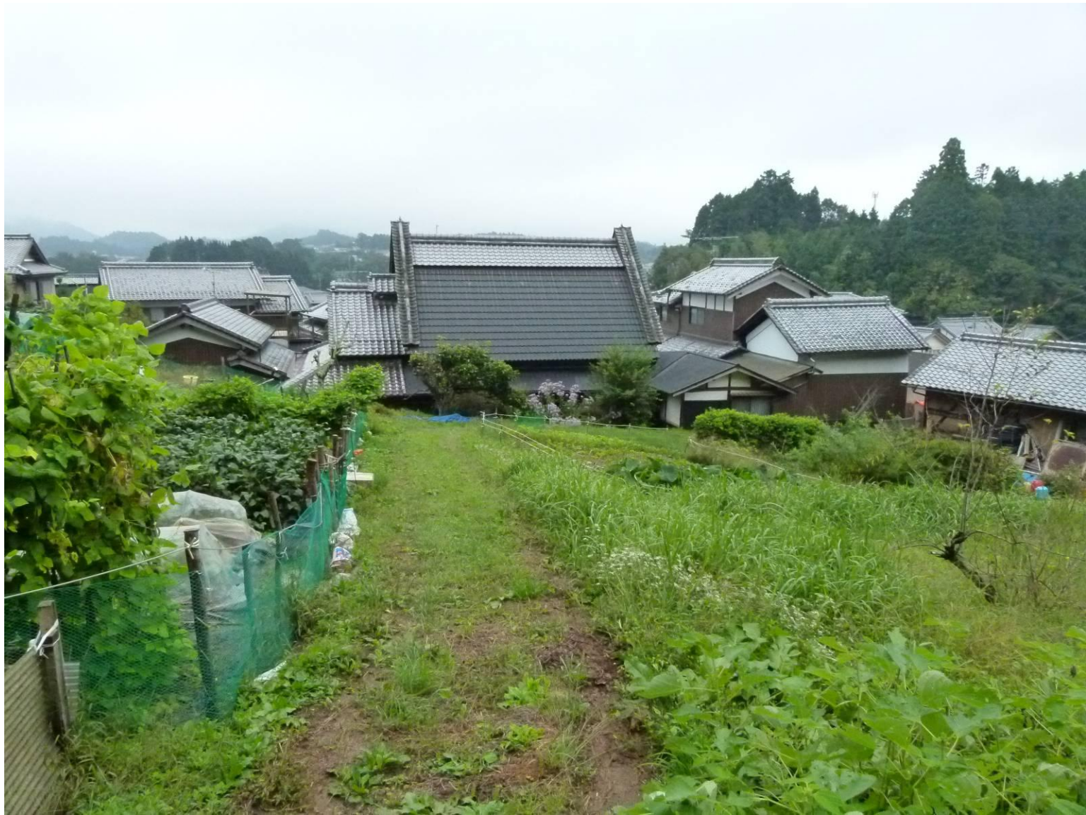
つげ 都祁の集落 大和棟の屋敷ー2