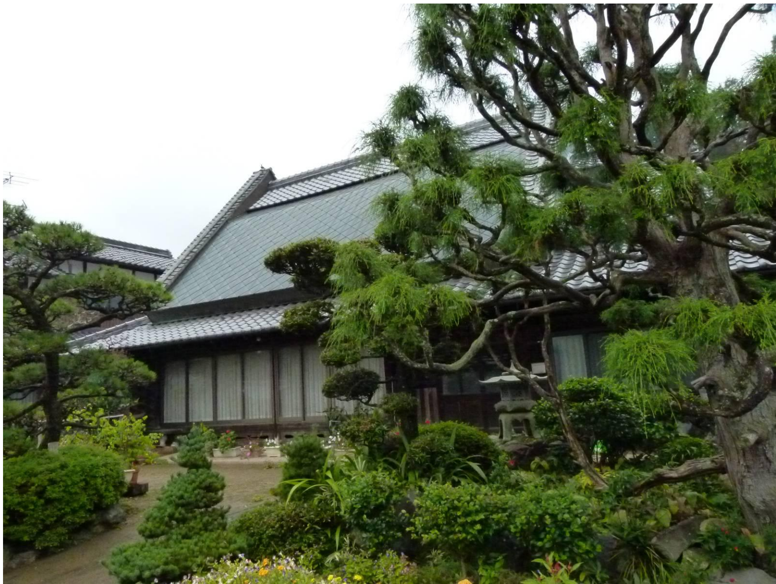
つげ 都祁の集落 大和棟の屋敷ー1